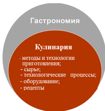
Рис. 1. Модель дефиниций «гастрономия» и «кулинария»

Следует отметить, что кулинария и гастрономия являются разными по значению терминами. Понятие «кулинария» включает в себя конкретную систему методов и технологий приготовления пищи из сырья (процессы дготовки или переработки), в том числе технологические процессы, оборудование и рецептуру блюд, гастрономия же является понятием более широким [2]. Соотношение понятий представлено на рис. 1.