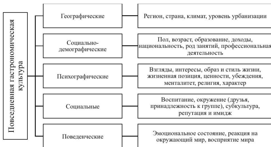
Рис. 3. Факторы, влияющие на субъективность восприятия повседневной гастрономической культуры

Культурологический подход к изучению повседневного питания предусматривает «взаимоотношения» человека и сферы питания. Учитывая индивидуальные особенности и присущие каждому индивидууму характерные черты, можно выделить определённые факторы, влияющие на субъективность восприятия повседневной гастрономической культуры, которые отражены на рис. 3.